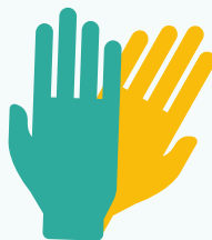
Gants jetables à usage unique (sans latex)