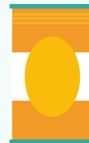
Couverture de survie