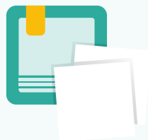
Compresse stérile à usage unique