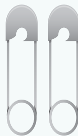
Épingles à nourrice