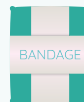
Bande de gaze élastique