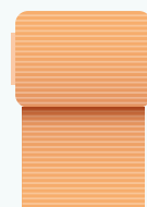
Bande adhésive type sparadrap